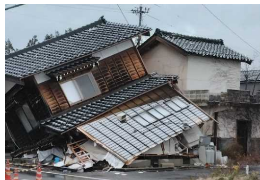
倒壊した家屋等の解体、撤去