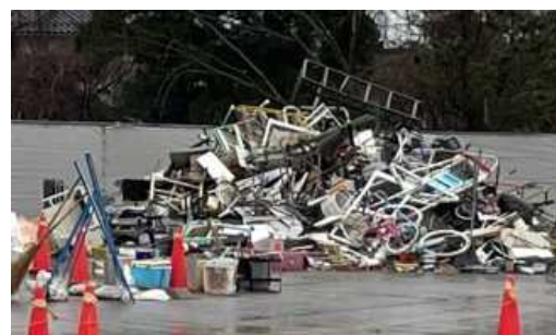
片付けごみの収集・運搬及び処分