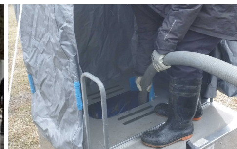
避難所の仮設トイレ等のし尿収集・運搬及び処分

お問合せ先： 環境省 環境再生・資源循環局 廃棄物適正処理推進課 03-5521-8337